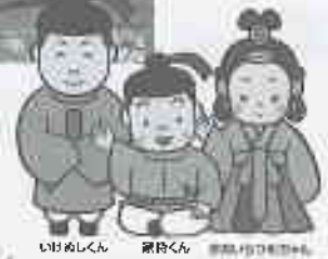
いしめしん 家持くん 雲龍山のつとむ