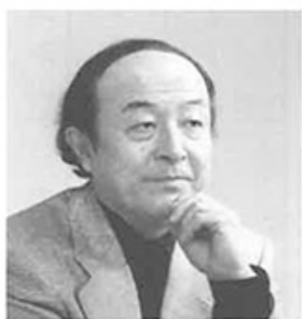
池辺 晋一郎 (作曲家)

1932年 東京都生まれ。52年俳優座演劇研究所付属俳優養成入所。舞台『幽霊』のオスワル役で鮮烈デビュー。以降、舞台俳優として数々の賞を受賞。映画には、台詞のない通りすがりの浪人役だったが黒沢明監督の『七人の侍』(54年)で映画初出演。その後、小林正樹監督『人間の条件』、黒沢明監督『用心棒』など日本映画界の巨匠たちの傑作に次々と出演する。1975年から俳優を育成する「無名塾」を亡き妻・宮崎恭子(女優、脚本家、演出家)と主宰。2007年、文化功労者受賞。