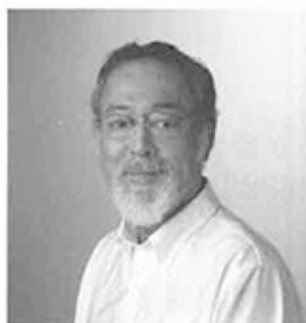
仲代 達矢 (俳優)

1932年 東京都生まれ。52年俳優座演劇研究所付属俳優養成入所。舞台『幽霊』のオスワル役で鮮烈デビュー。以降、舞台俳優として数々の賞を受賞。映画には、台詞のない通りすがりの浪人役だったが黒沢明監督の『七人の侍』(54年)で映画初出演。その後、小林正樹監督『人間の条件』、黒沢明監督『用心棒』など日本映画界の巨匠たちの傑作に次々と出演する。1975年から俳優を育成する「無名塾」を亡き妻・宮崎恭子(女優、脚本家、演出家)と主宰。2007年、文化功労者受賞。