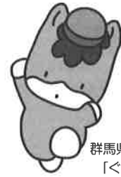
群馬県のマスコット 「ぐんまちゃん」

たくましく生きる力をはぐくむ社会教育のあり方 ～温もりのある地域社会をめざして～