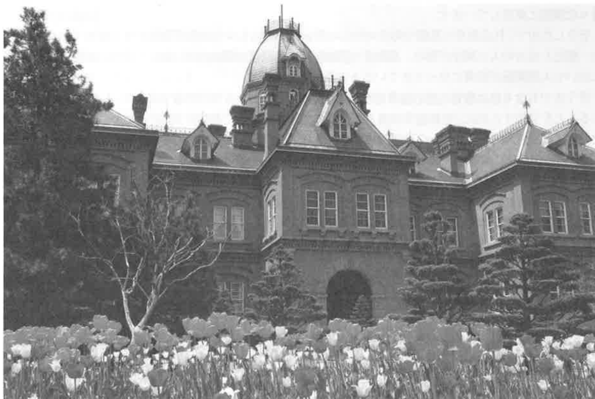
国指定史跡重要文化財 北海道庁旧本庁舎