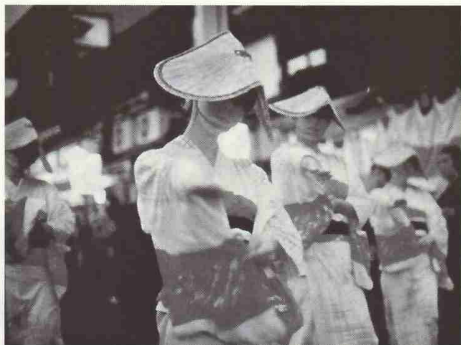
越中八尾おわら風の盆