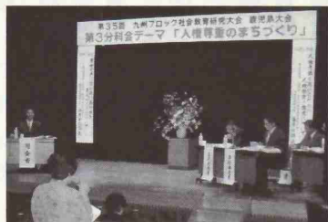
分科会での熱心な協議

体制づくり」、②「地域での青少年健全育成」、③「人権尊重のまちづくり」、④「生涯学習のまちづくり」を設定し、各会場ごとに二県の事例発表を基に、それぞれ熱心な質疑や研究協議がなされました。