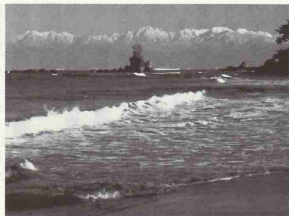
富山湾と立山連峰