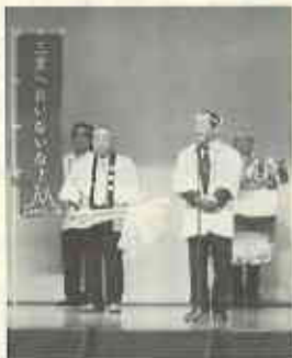
次回開催地挨拶 ～第54回山梨大会にて～